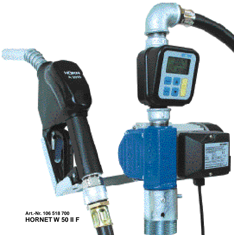
Art.-Nr. 106 518 700 HORNET W 50 II F